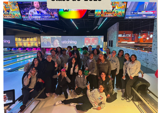
Clase de 2025

¡65 horas de servicio comunitario y caminos por recorrer antes de abril!